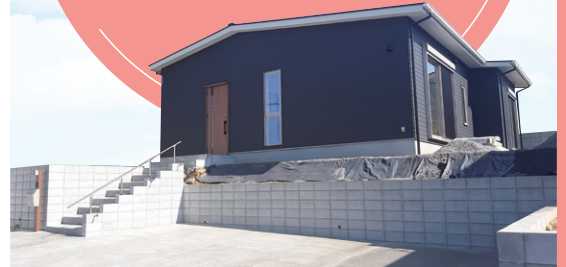
▲写真は10月27日に撮影。