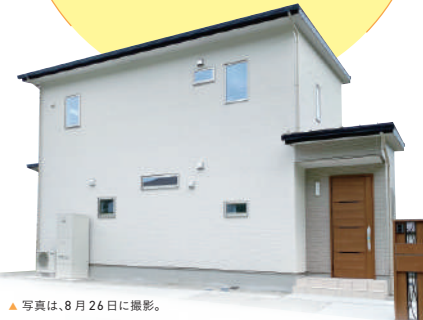
▲写真は、8月26日に撮影。